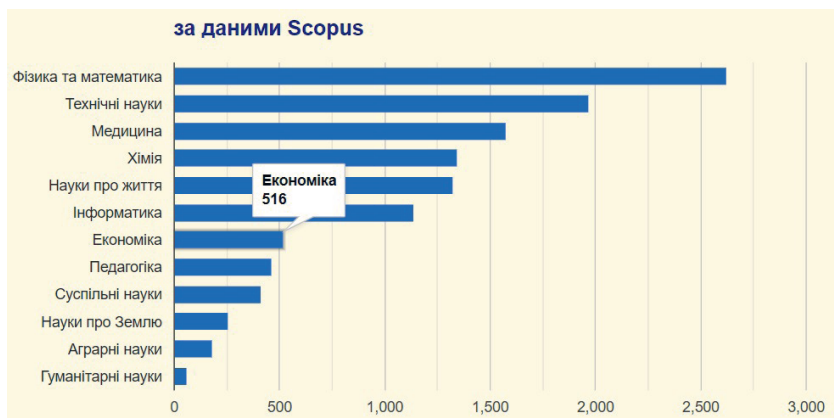
Рис. 2. Галузевий розподіл науковців, які мають бібліометричні профілі в Scopus

Наведений нижче рис. 2 ілюструє публікаційну активність українських науковців у періодичних виданнях, що індексуються системою Scopus.