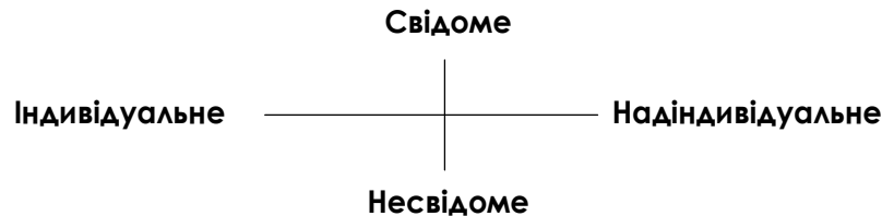
Рис. 1. Змістові координати методологічного простору соціально-психологічного теоретизування (за М. Слюсаревським)

Останній визначається змістовими координатами методологічного простору соціально-психологічного теоретизування. У свою чергу, цим положенням задається також і перший принцип психологічного забезпечення соціального прогнозування , який впливає з визначення предмета соціальної психології і який потребує уваги під час прогнозування соціальних процесів.