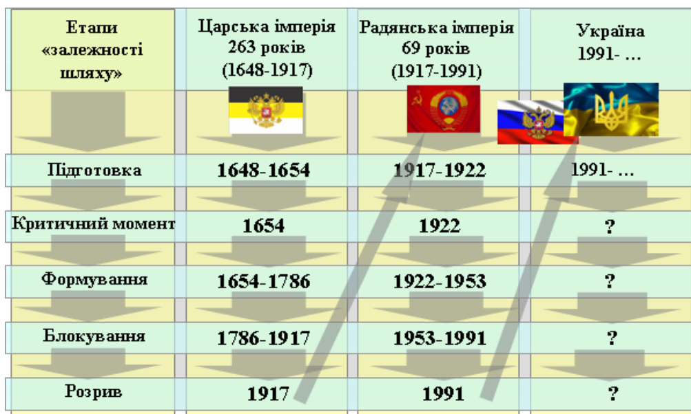
Рис. 1. Історичні паралелі «залежності шляху» України в Царській і Радянській імперіях до сьогодення

Національно-визвольна війна 1648-1654 рр., або Хмельниччина, мала вирішальне значення для формування суб'єктності України у ті часи (Музичук та ін., 2008). На початку XVII ст. Польща цілеспрямовано наближалась до повного панування в Україні, але: «Епоха Богдана Хмельницького повернула старовинну суперечку в протилежний бік» (Костомаров, 2004, с. 23). Перед підписанням Переяславських угод Україна «... була фактично і юридично цілком самостійна держава ... Україна не визнавала над собою іншої влади, крім влади свого гетьмана, і як вільну, незалежну державу Україну трактував і московський цар. Фактично Україна стала вільною ще перед зазначеними договорами» (Яковлів, 2003, с. 119).