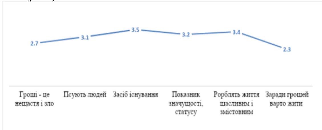
Рис. 1. Ставлення підлітків до грошей

В умовах економічного сьогодення формується і ставлення до самого майна – тих матеріальних (а часом і нематеріальних) ресурсів, у відносинах щодо володіння, користування і розпорядження якими постає сама особистість, зокрема у процесі формування її майнової ідентичності (рис. 1).