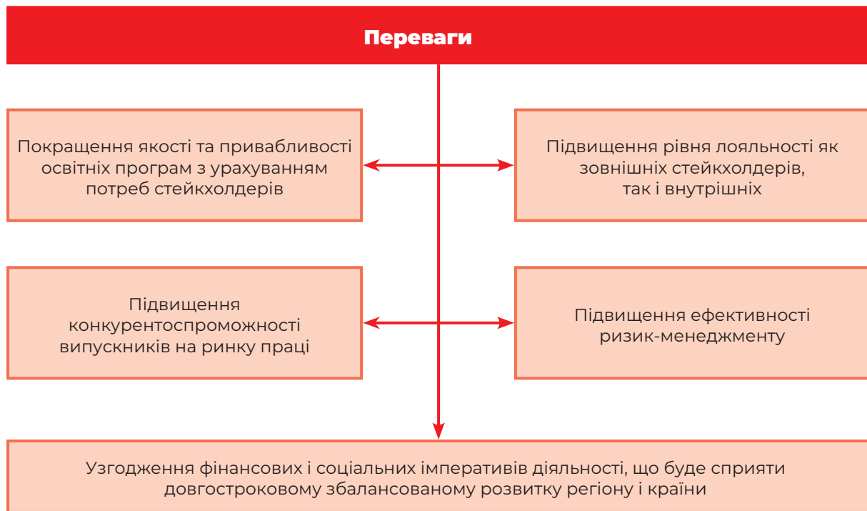
Рис. 1. Стратегічні переваги формування репутаційного капіталу ЗВО на засадах соціальної відповідальності (І. Ховрак) 103

суспільної значущості і тому починає регулюватися за допомогою соціальних норм» 104 . Це важливе в методологічному сенсі твердження, що дає змогу вийти з прокрустового ложа вузькоформатного трактування соціальної відповідальності, у якому точиться теоретичний дискурс із її проблематики.