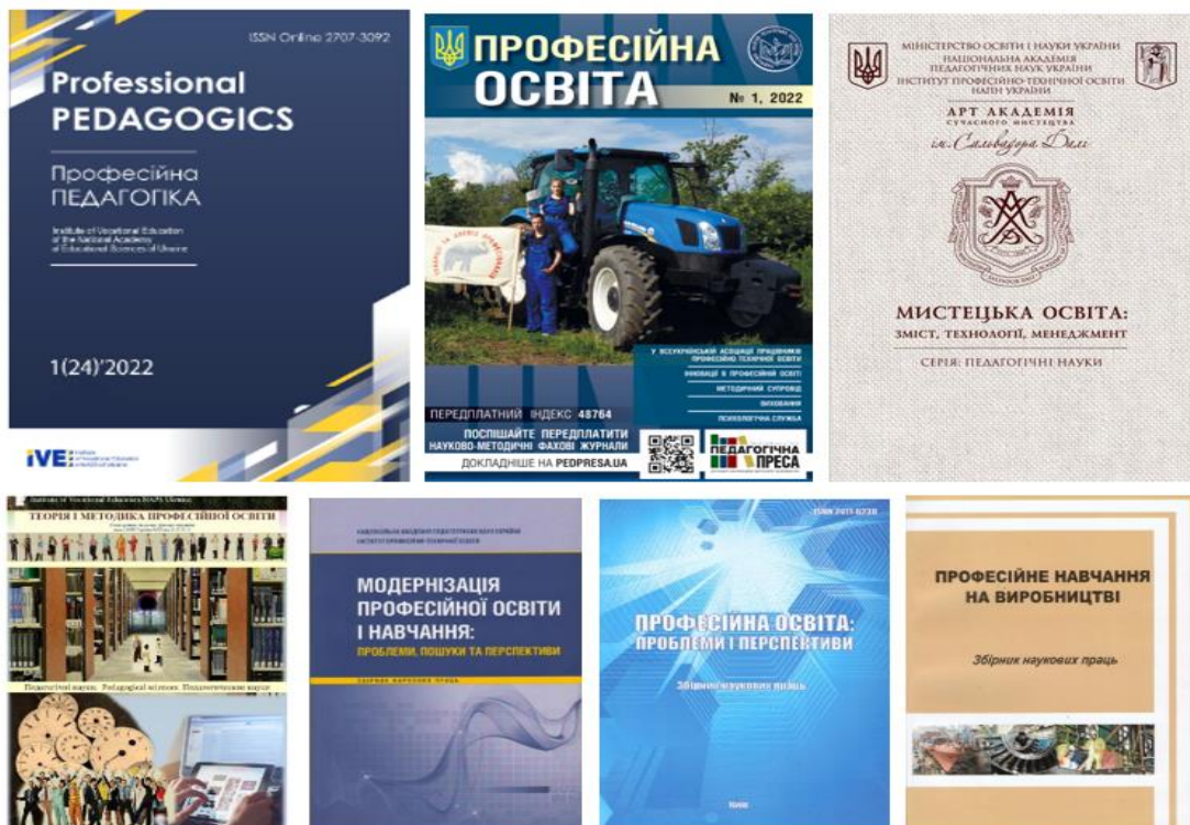
Рис. 2. Періодичні видання Інституту професійної освіти НАПН України

раїни. Професійна педагогіка») та співзасновником наукометричного видання «Мистецька освіта: зміст, технології, менеджмент» і науково-методичного журналу «Професійна освіта», в якому друкуються матеріали з питань дидактики й історії професійної школи, виховання, професійної орієнтації та ефективного вивчення предметів різного профілю в закладах професійної освіти, коментарі та статті провідних профтехосвітян (рис. 2).