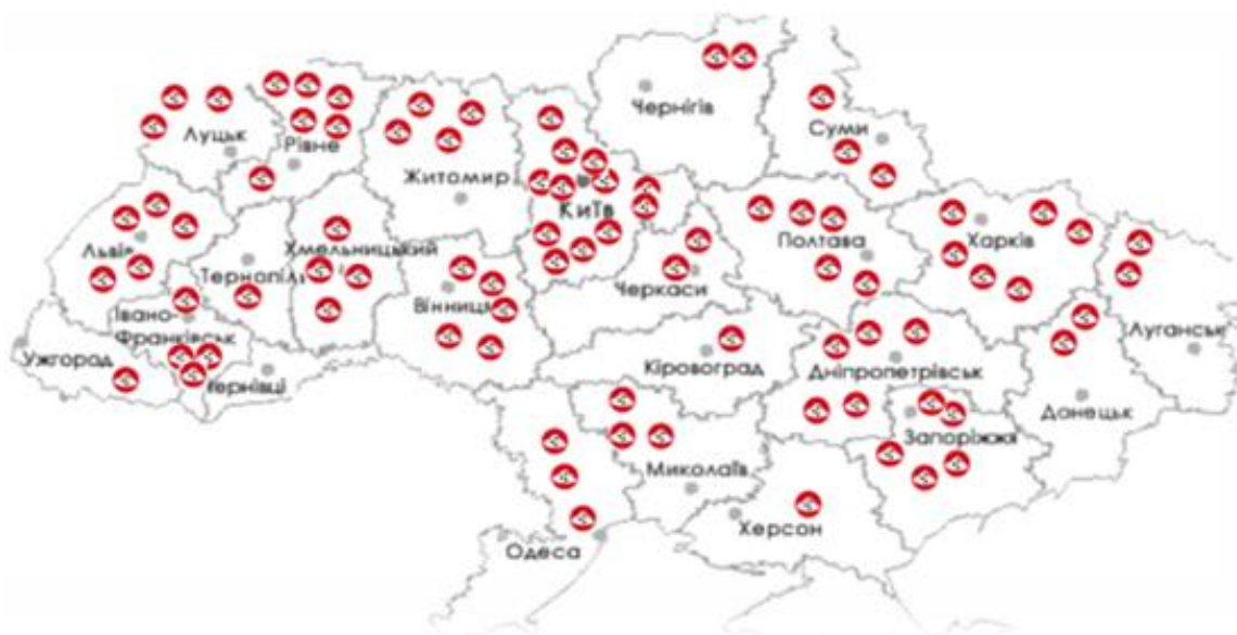
Рис.3. Інноваційна освітня діяльність Інституту професійної освіти НАПН України (2006-2021)

Суб'єктами експериментальної діяльності є Інститут (ініціює відкриття, виконує дослідження, впроваджує наукові результати та звітує про використання бюджетних коштів); шість лабораторій (забезпечують розроблення програми експериментальної діяльності, організацію збору емпіричних даних, дослідну перевірку розроблених педагогічних інновацій та впровадження отриманих результатів; науково-організаційний відділ, що забезпечує інформаційно-комунікаційний супровід експериментальної діяльності; наукові працівники, як безпосередні розробники і виконавці передбачених програмою наукового дослідження завдань на кожному етапі експериментальної роботи відповідно до індивідуального робочого плану. Об'єктами експериментальної діяльності є органи державної влади та органи місцевого самоврядування, заклади освіти, установи, підприємства, організації, на базі яких проводяться експерименти. Отже, в інноваційній освітній діяльності різних рівнів (всеукраїнського, регіонального, підвідомчої установи НАПН України) беруть участь всі лабораторії і центри Інституту, а також педагоги й керівники майже 100 закладів освіти з усіх областей України (рис.3).