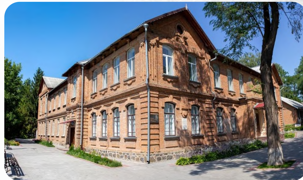
ПАВЛИСЬКА СЕРЕДНЯ ШКОЛА

https://mon.gov.ua/ua/tag/nova-ukrainska-shkola