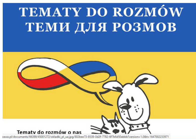
Рис.2. Скрін веб-сайту Управління освіти міста Варшава

Крім того, Союз польських митрополій у співпраці з Управлінням освіти міста Варшава та з ініціативи Фундації «Я люблю Польщу» підготували польсько-український підручник під назвою «Познайомтеся та побудуйте стосунки», який буде регулярно доповнюватися новими темами. Він призначений для родин, які приймають у себе біженців або організовують вільний час для українських дітей. Його також можуть використовувати вчителі як додаткове джерело знань, що дозволяє дітям вивчати мову та отримувати цікаву інформацію про Польщу та Україну. Посібник включає тексти, малюнки та вправи (Рис.2).