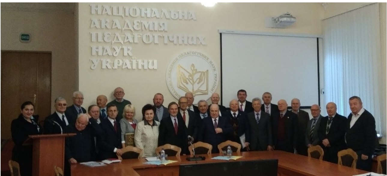
Загальні збори Відділення вищої освіти НАПН України 16 листопада 2018 р.