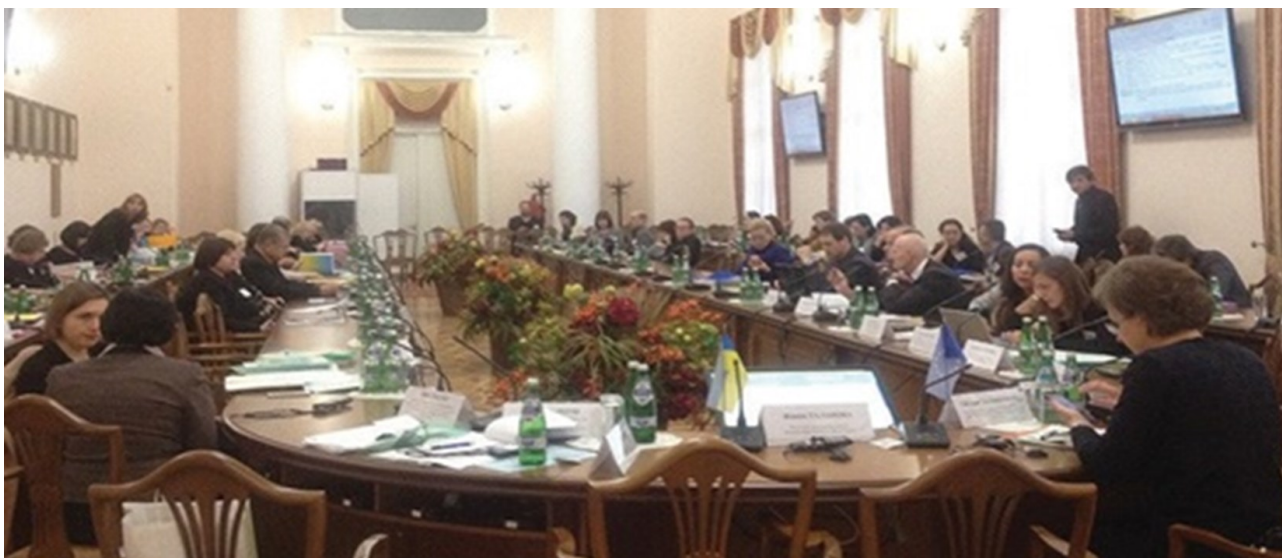
Міжнародна науково-практична конференція «Європейська інтеграція вищої освіти України в контексті Болонського процесу» в Київському національному університеті імені Тараса Шевченка (2016 р.) за участю членів Відділення вищої освіти НАПН України

Загалом упродовж 1991-2010 рр. результати наукових досліджень вчених Відділення засвідчи-