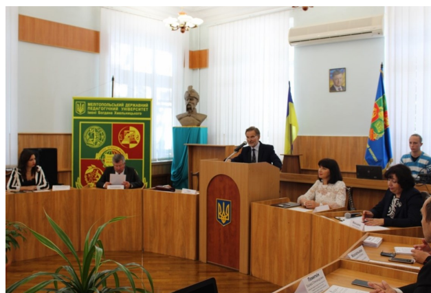
Круглий стіл «Майбутнє університетів в контексті експоненціальних технологій» (Мелітопольський державний педагогічний університет ім. Богдана Хмельницького, 2019 р.)

• розроблення системи показників для оцінювання ефективності діяльності університетів України та рекомендацій щодо її оцінювання для національного, секторального та інституційного рівнів; визначення й обґрунтування механізмів розширення фінансової автономії закладів вищої освіти та окреслення шляхів руху до створення університетів світового класу;