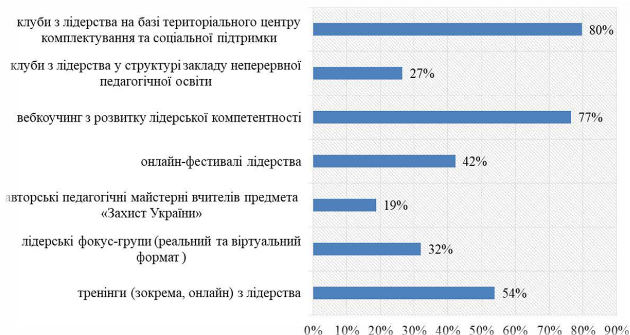
Рис. 2. Опитування щодо ефективності форм розвитку лідерської компетентності вчителів захисту України

Так, під час проведення опитування (128 учителів) респондентам пропонувалося оцінити ефективність кожної із форм роботи у контексті розвитку їх лідерської компетентності (рис. 2):