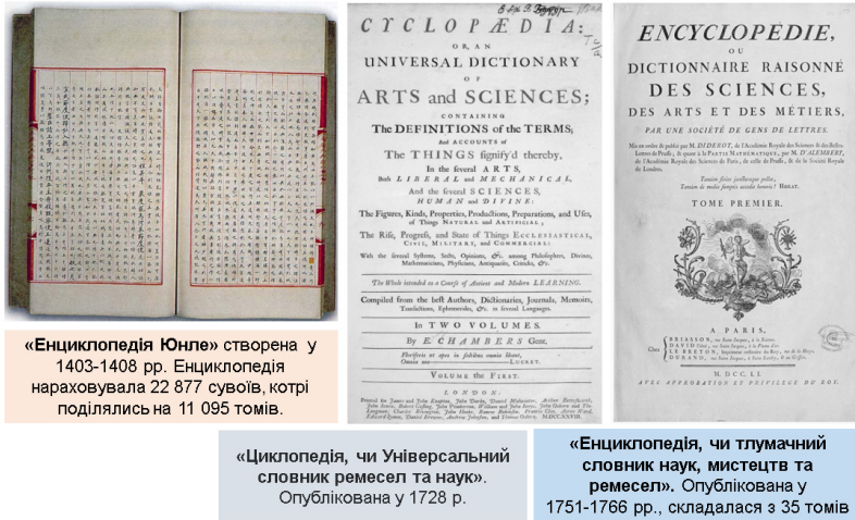
«Енциклопедія Юнле» створена у 1403-1408 рр. Енциклопедія нараховувала 22 877 сувоїв, котрі поділялись на 11 095 томів.