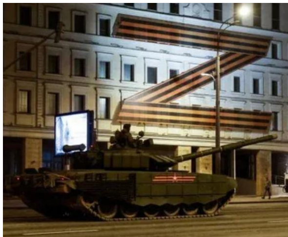
Зображення символу рашизму на приміщенні під час репетиції параду у Москві до 9 травня 2022 року

1. Відсутність у стратегії всебічного розвитку Росії та її народу цивілізаційної парадигми, національної ідеї, вмотивованості, патріотизму, соціальної-економічної концепції тощо;