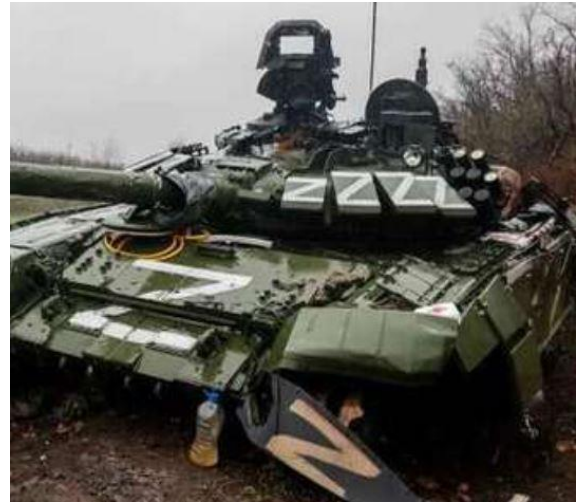
Зображення символу рашизму на знищеному ворожому російському танку – весна 2022 року.

Приходимо до висновку, що боротьба з рашизмом та його наслідками є завданням загальноцивілізаційним, оскільки маємо убезпечити негативний вплив на біосферу, ноосферу та сприяти зменшенню некросфери з метою розроблення простору доступного для життя у гармонії з природою, що по суті окреслює перспективи цивілізації. Цим самим людство зменшуватиме рівень колективного егоїзму, формуючи свідомість і розвиваючи її рівні. Разом з тим маємо усвідомлювати, що рашизм є тимчасовим явищем, оскільки люди підійшли до відповідального періоду життя на планеті – пізнанні самих себе та розумінні необхідності єдності світу, що дозволить перетворити гармонію сукупного духовного та інтелектуального ресурсу і його творчої енергії у вирішальний фактор еволюційного поступу.