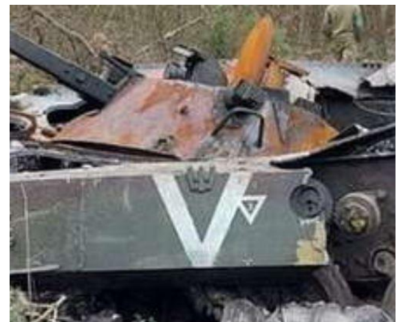
Зображення символу рашизму на знищеній ворожій російській бойовій машині піхоти – весна 2022 року.