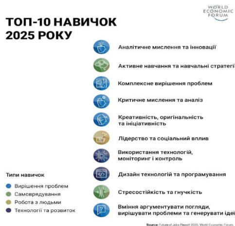
Рис. 1. Топ-10 навичок 2025 року

У жовтні 2020 року на Світовому Економічному Форумі було названо топ-10 навичок 2025 року (Рис. 1).