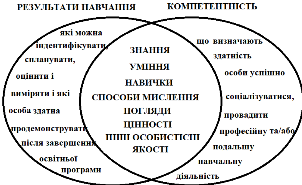
Рисунок. Співвідношення компетентності й результатів навчання

Як бачимо поняття «компетентність» і «результат навчання» збігаються у переліку того, що має бути здобуте, сформоване й розвинуте у процесі навчання і життєдіяльності (рисунок).