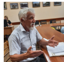
Ми зустрілися у Бориспільській бібліотеці, де пахло старими книгами, відчувався присмак радянського минулого з атрибутами української сучасності.

В атмосфері переплетіння різних епох наша розмова з авторитетною особистістю про бачення незалежності, про безкінечність Українського визвольного руху і причини нинішнього стану речей у країні. Ми торкнулися релігійно-містичного вчення Рудольфа Штайнера і психотипу малоросів за версією Павла Чубинського. Спірозмовник вбачає сакральне призначення української нації та вплив на неї космічних процесів, висловлює надії на покоління Z і радить, як гармонізувати внутрішнє «я».