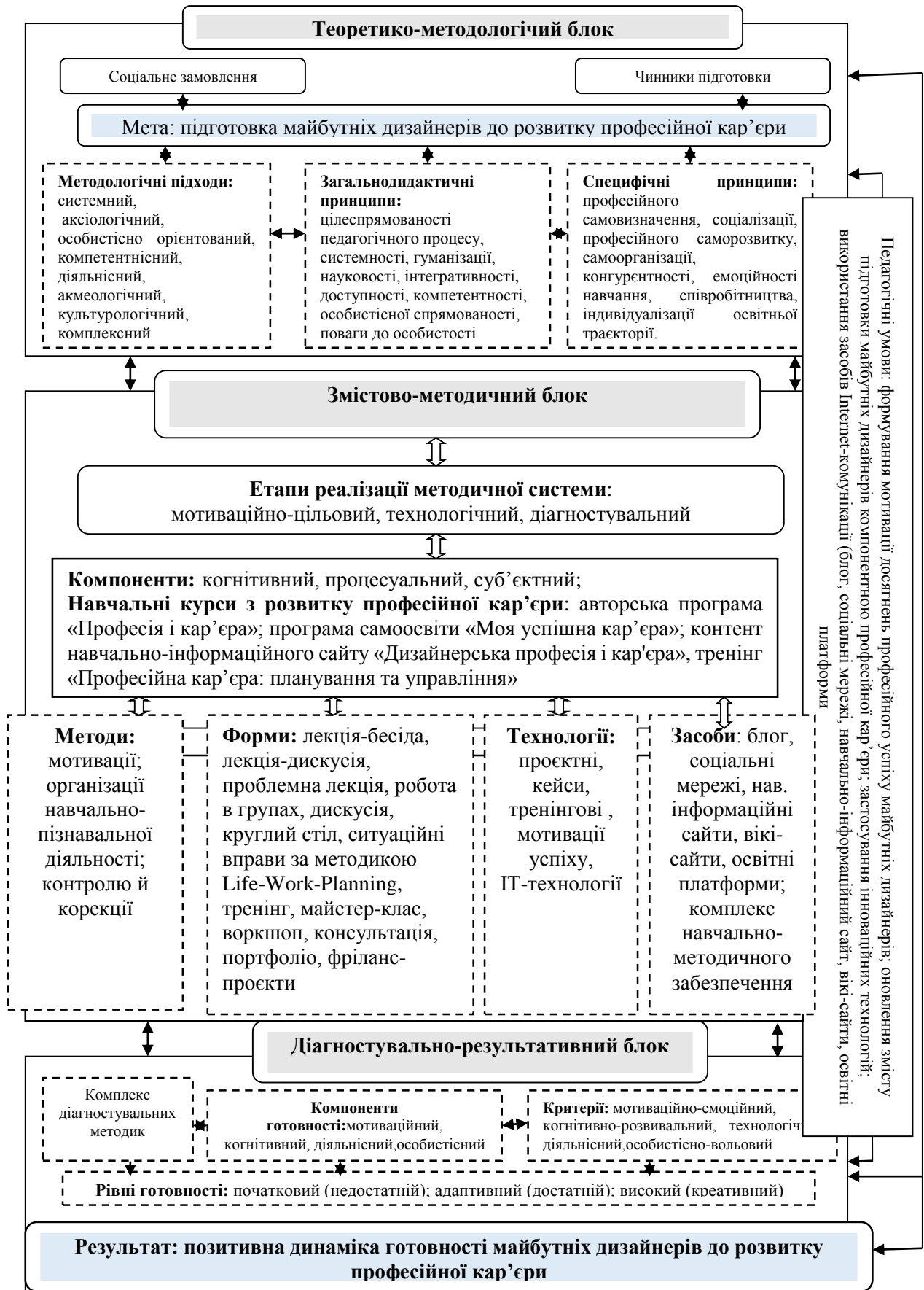
Рис. 1. Модель підготовки майбутніх дизайнерів до розвитку професійної кар'єри (розроблено автором)