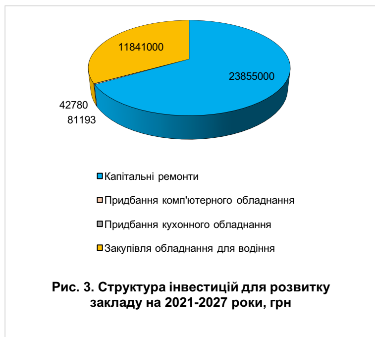
Рис. 3. Структура інвестицій для розвитку закладу на 2021-2027 роки, грн

Виконання завдань Стратегічного та інвестиційного плану розвитку Маріупольського професійного ліцею автотранспорту здійснюватиметься упродовж двох етапів: 2021-2023 та 2024-2027 роки.