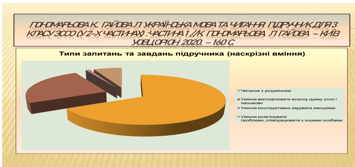
Рисунок 1. Типи запитань і завдань для формування наскрізних умінь у підручнику «Українська мова та читання», част. 1 (авт. Пономарьова К., Гайова Л.) [1]

Кількісний аналіз методичного апарату першого підручника (рис. 1) [1] показує, що найбільший відсоток в ньому з проаналізованих 651 позицій провідну займають запитання та завдання на формування вміння читати з розумінням (перша підгрупа – 333/ 51%; друга підгрупа – 103/16% ); уміння висловлювати власну думку усно і письмово займають другу позицію (перша підгрупа – 37/5,5% та друга – 126/19%); уміння конструктивно керувати емоціями – 5/1% (але багато завдань інших підгруп мало емоційне забарвлення); уміння розв’язувати проблеми, співпрацювати з іншими особами (52/8,5% за усіма підгрупами).