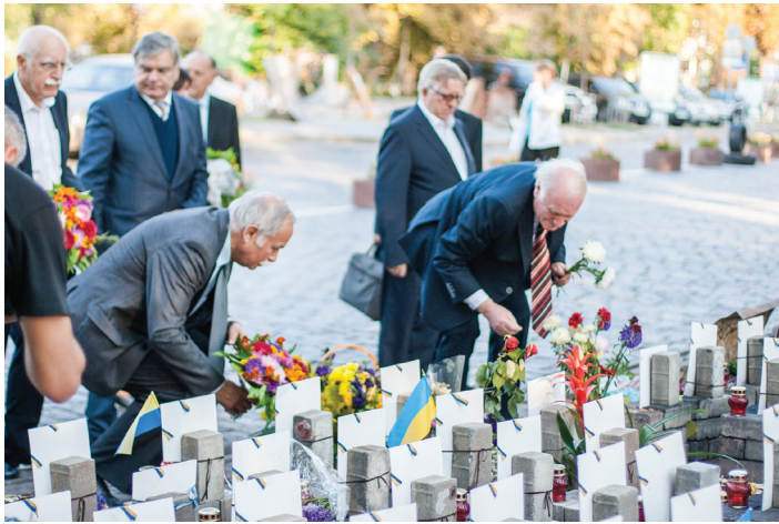
Делегати VI Українсько-польського / польсько-українського наукового форуму «Освіта для сучасності» = «Edukacja dla współczesności» покладають квіти до пам'ятника Героям Небесної Сотні (м. Київ, 14 вересня 2015 р.)