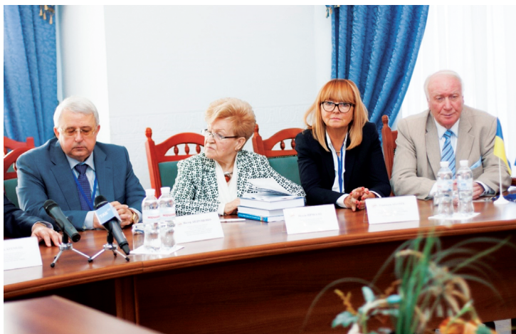
Пленарне засідання VI Українсько-польського / польсько-українського наукового форуму «Освіта для сучасності» = «Edukacja dla współczesności» (м. Київ, 14 вересня 2015 р.)