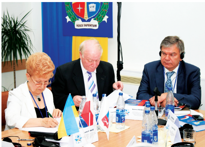
Учасники пленарного засідання IV Українсько-польського / польсько-українського наукового форуму «Розвиток педагогічних наук в Україні і Польщі на початку XXI століття» (м. Черкаси, 2011 р.)