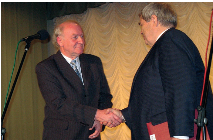
Урочистість з нагоди відзначення 15-річчя Інституту педагогічної освіти і освіти дорослих НАПН України (м. Київ, 19 листопада 2008 р.)