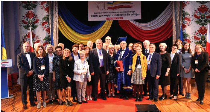
Учасники VIII Українсько-польського / польсько-українського наукового форуму «Освіта для миру» = «Edukacja dla pokoju» (м. Київ, 10 жовтня 2019 р.)