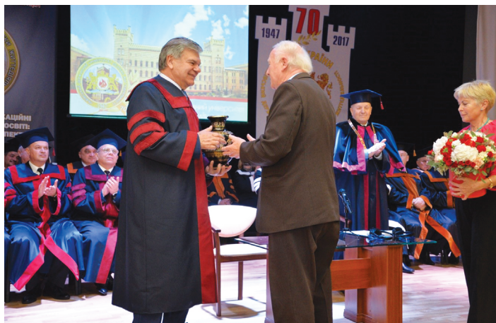
Професор Ф. Шльосек вітає Президента НАПН України В. Кременя з присвоєнням звання «Почесний доктор (HONORIS CAUSA) Львівського державного університету безпеки життєдіяльності» (м. Львів, 19 жовтня 2017 р.)