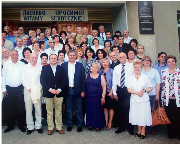
Учасники IV Українсько-польського / польсько-українського наукового форуму «Розвиток педагогічних наук в Україні і Польщі на початку XXI століття» у гімназії імені Кароля Шимановського Кам'янського району Черкаської області (24 травня 2011 р.)