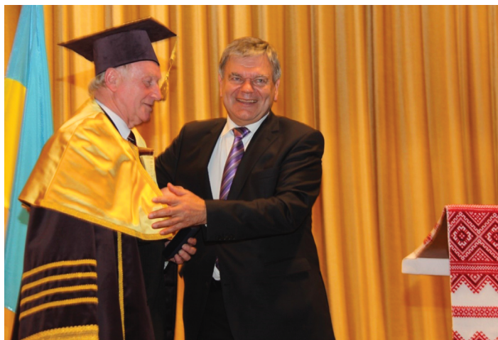
Президент НАПН України В. Кремень вітає Ф. Шльосека з присвоєнням звання Почесного доктора (HONORIS CAUSA) Хмельницького національного університету (м. Хмельницький, 16 жовтня 2013 р.)