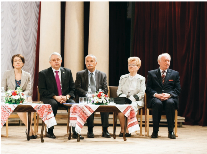
Урочисте відкриття VI Українсько-польського / польсько-українського наукового форуму «Освіта для сучасності» = «Edukacja dla współczesności» у Національній філармонії України (м. Київ, 14 вересня 2015 р.)