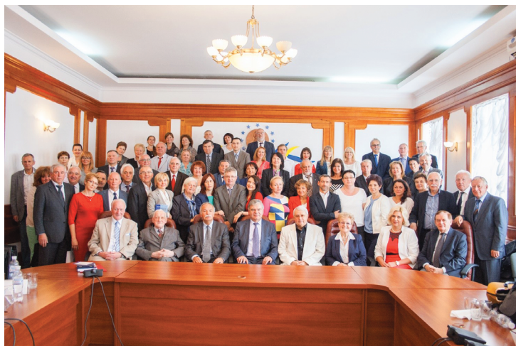
Учасники VI Українсько-польського / польсько-українського форуму «Освіта для сучасності» = «Edukacja dla współczesności» (м. Київ, 14 вересня 2015 р.)