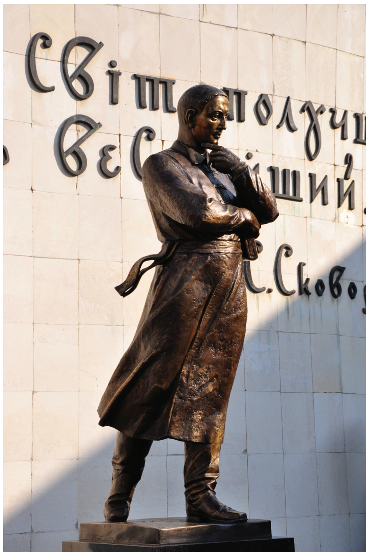
Харківський національний педагогічний університет імені Г. С. Сковороди