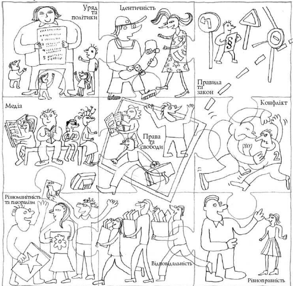
Рис. 1. Пазл-ілюстрація до серії посібників Ради Європи з питань освіти для демократичного громадянства (П. Віксман 30 )

Рівноправність і свобода. Ці два ключові поняття розглядають разом. На думку експертів РЄ, свобода та рівність формують діалектичну єдність протилежностей 29 . Перша не може розглядатись без другої, але водночас ці поняття є різними.