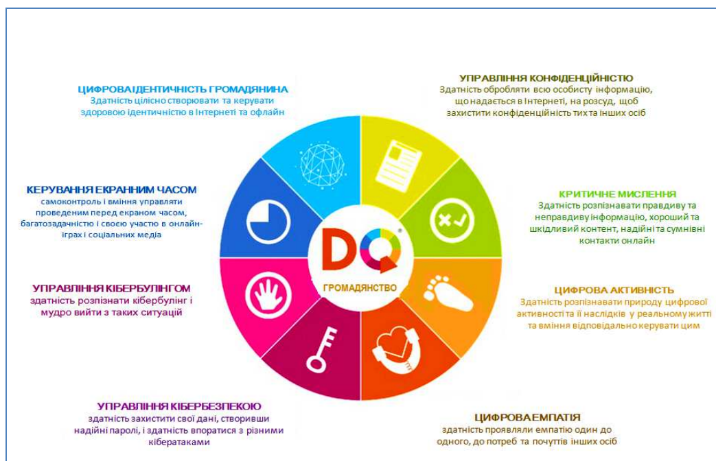
Рис. 2 Складники цифрового громадянства 38

Привернення уваги до цифрового інтелекту сучасної людини, вчителя зокрема, пояснюється тим фактом, що для основного покоління сучасних вчителів ІКТ та цифрові медіа були не досить розвиненими сферами у професійній діяльності. Натомість сьогодні ці питання є важливими та обов'язковими для досягнення успіху у всіх сферах життєдіяльності людини. Саме сьогодні цифрові навички та цифрова компетентність стали невід'ємною частиною цілісної системи освіти. Цифрова компетентність увійшла як ключова до основних стратегічних рекомендацій та стандартів розвинених країн світу, стала предметом уваги освітніх політик багатьох країн.