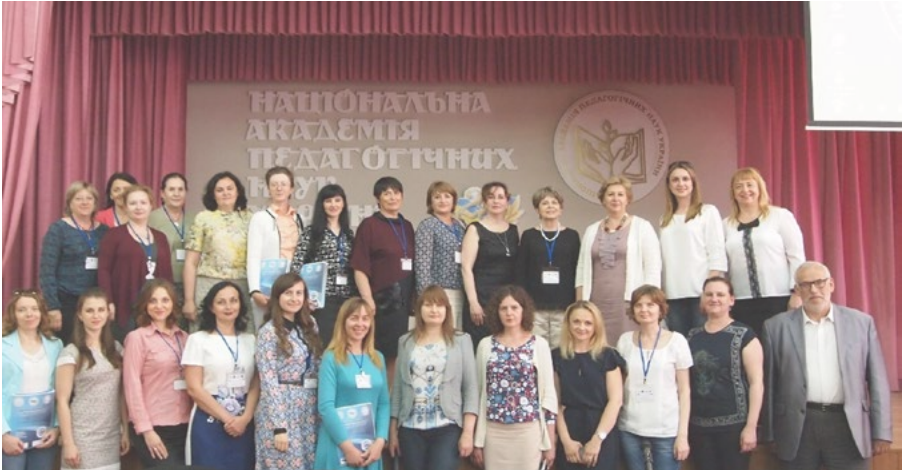
На фото: учасники міжнародної науково-практичної конференції «Педагогічна компаративістика і міжнародна освіта – 2018»

науки і техніки України, завідувачка відділу порівняльної педагогіки Інституту педагогіки НАПН України та учасники міжнародної науково-практичної конференції «Педагогічна компаративістика і міжнародна освіта – 2019»