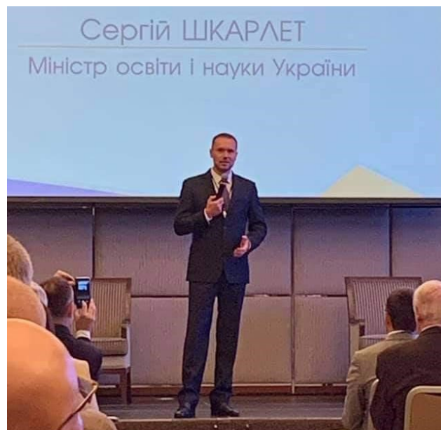
Виступ Міністра освіти і науки України Сергія Шкарлета

Він додав, що насамперед потрібно розвивати практичні навички, професійні та особисті якості, створити вільний простір для творчості, формувати науковий світогляд з якомога більш раннього віку.