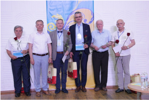
Урочисте вручення сертифікатів представникам польської делегації

по-перше , упровадження у національний освітній простір основних цінностей та компетентностей освіти (кардинальне оновлення системи підготовки та супроводу компетентного вчителя для нової української школи);