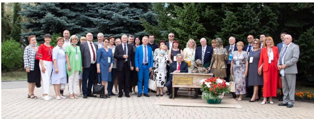
Делегація науковців НАПН України та Інституту педагогічної освіти і освіти дорослих імені Івана Зязюна НАПН України серед учасників конференції

У пленарному засіданні Всеукраїнської стратегічної сесії «Освіта України — 30. Національний технопарк з підвищення якості освіти» взяли участь представники МОН України на чолі з Міністром освіти і науки України Сергієм Шкарлетом, представники Верховної Ради України, зокрема, заступник Голови Комітету Верховної Ради України з питань освіти, науки та інновацій Сергій Колебошин і Голова підкомітету з питань вищої освіти Комітету Юлія Гришина, делегація вчених НАПН України, польська делегація, а також керівники Харківської ОДА, керівники обласних департаментів (управлінь) освіти і науки, ректори (директори) закладів вищої та післядипломної педагогічної освіти, очільники Українського інституту розвитку освіти, Малої академії наук та інші.