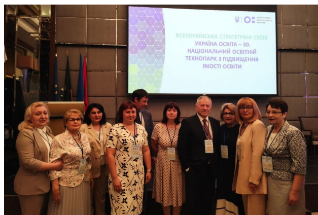
Делегація вчених НАПН України та Інституту педагогічної освіти і освіти дорослих імені Івана Зязюна НАПН України

«Одним із напрямів цього компоненту є державно-приватне партнерство — це механізм, що використовується в більшості успішних країн світу. За його рахунок будуються нові або модернізуються існуючі заклади освіти, спортивні майданчики, стадіони, відкриваються сучасні шкільні наукові лабораторії, оновлюється матеріально-технічне забезпечення тощо. Такі приклади