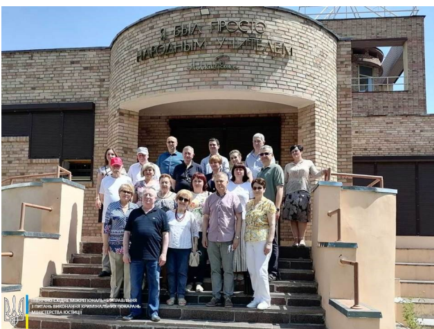
Відвідання Центру-музею Антона Макаренка представниками польської делегації та вченими НАПН України

Центр-музей Антона Макаренка був відкритий при Курязькій виховній колонії для неповнолітніх імені А. Макаренка у селищі Подвірки Дергачівського району Харківської області 13 березня 1988 року — до 100-річчя з дня народження видатного педагога, коли під егідою ЮНЕСКО педагогічна