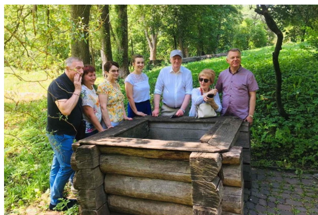
Відвідання Національного літературно-меморіального музею Г.С. Сковороди представниками польської делегації та вченими НАПН України

громадськість всього світу відзначала цю подію. Учасники конференції, котрі побували в музеї вперше, дійсно відкрили для себе цю історичну пам'ятку — взірць музейного будівництва з різноманітними експозиціями. Усі присутні із задоволенням прослухали розповідь екскурсовода і переглянули документальний фільм «Завоювання Куряжа».