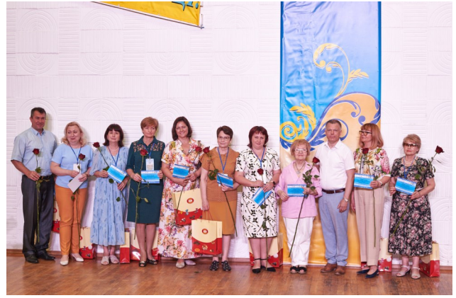
Урочисте вручення сертифікатів представникам делегації з НАПН України

Вишуканим мистецьким подарунком для учасників конференції стала яскрава концертна програма від творчих колективів — народних ансамблів бального та народного танцю, вокаль-