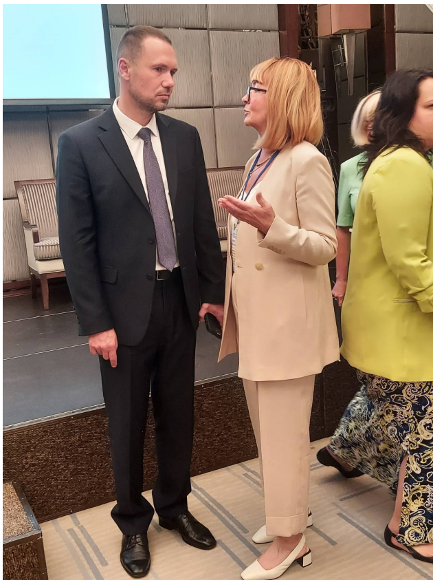
Спілкування директора Інституту педагогічної освіти і освіти дорослих імені Івана Зязюна НАПН України Лариси Борисівни Лук'янової з Міністром освіти і науки України Сергієм Шкарлетом на виставці «Освіта Харківщини – 30: плануємо, експериментуємо, упроваджуємо»

Онлайн-трансляція заходу демонструвалася на YouTube-каналі та Facebook-сторінці МОН України.