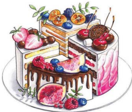
Рис. 3. Тортик почуттів