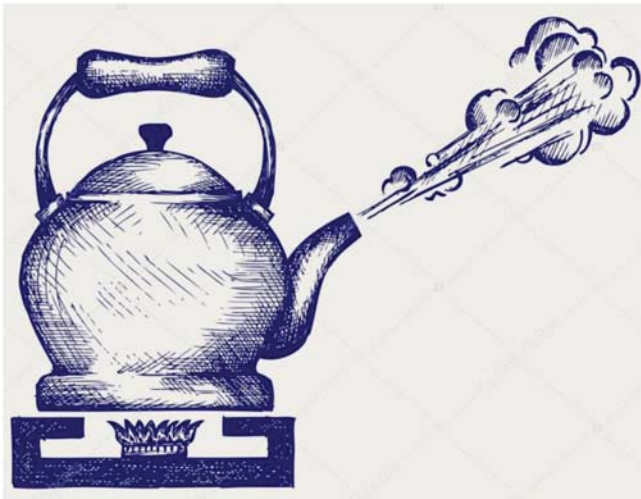
Рис. 1. Киплячий чайник

Батькам пропонуються малюнки з чайниками, кожен має позначити, як він відчувається зараз, наскільки їхній чайник гарячий чи закипів. Після цього пригадати свій складний день. Потім сказати, як «вогник» емоцій впливає на дітей, які знаходяться поряд з «киплячим чайником» (рис. 1).