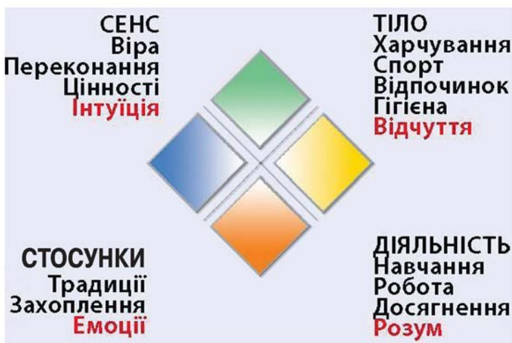
Рис. 1. Кристал Пезешкіана 3