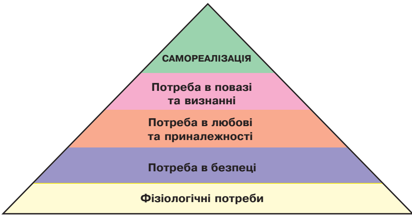
Рис. 1. Піраміда потреб

Якщо ми плановано задовольняємо потреби дитини, вона росте щасливою. Незадоволення потреб, призводить до того, що дитина росте нещасною. Ця концепція допомагає зрозуміти, що робить людину щасливою чи навпаки. Будь-яка поведінка дитини (вередування, страх, непослух, агресія тощо) пояснюється цією теорією. Якщо матимемо чіткі уявлення про потреби дитини, ми зможемо не тільки зрозуміти її поведінку, а й виправити.