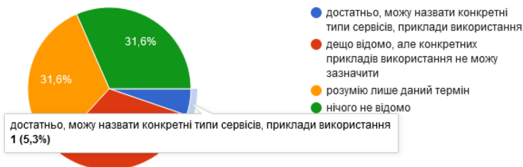
Рис. 3. Обізнаність студентів з Європейською хмарою відкритої науки

Тобто, якщо у студентів обізнаність про відкриту науку та EOSC досить низька, то що вже можна говорити про вчителів-практиків? Можливо, проблема існує ще на етапі навчання в ЗВО. Але для того, щоб зробити вагомі висновки слід провести опитування репрезентативної вибірки вчителів усіх областей України та студентів педагогічних ЗВО.