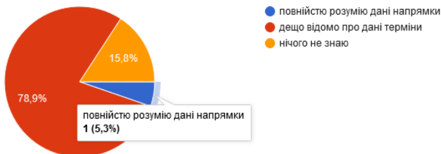
Рис. 2. Обізнаність студентів з відкритою наукою чи відкритими даними

Для порівняння було проведено опитування студентів Національного університету біоресурсів та природокористування спеціальності Інформаційно-комунікаційні технології в освіті, 011 Освітні, педагогічні науки, 01 Освіта/Педагогіка, 2020-2021 н.р.. Загальна кількість респондентів становить – 19 студентів (рис. 2, рис. 3). Слід зауважити, що лише 1 респондент із загальної кількості опитаних повністю розуміє що таке відкрита наука чи відкриті дані. Натомість 15 студентів відповіли, що їм лише дещо відомо про дані поняття (рис. 2). Лише 1 респондент знає достатньо про Європейську хмару відкритої науки та може вказати конкретні типи сервісів, навести приклади використання. 6 студентів відповіли, що взагалі не знають що це таке – Європейська хмара відкритої науки (рис. 3).