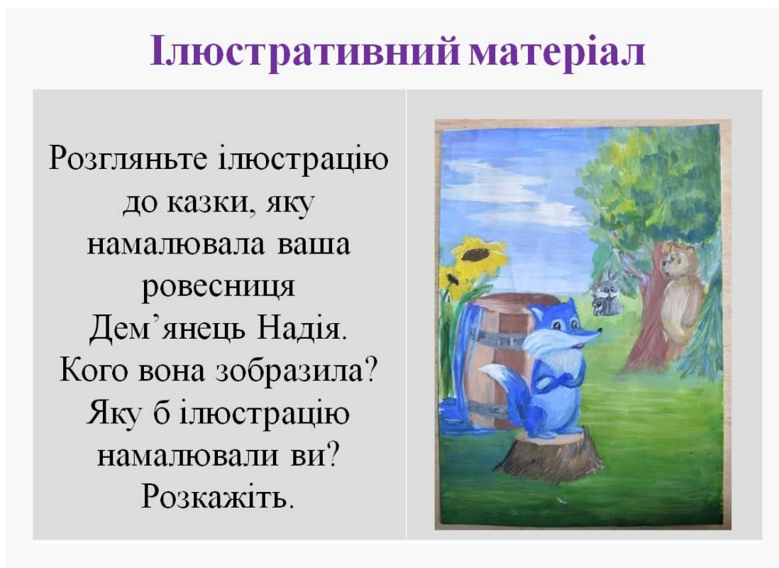
Рис. 7. Ілюстративний матеріал компетентісно орієнтованого підручника української літератури

Належну роль слід відвести ілюстративному матеріалу підручника. Він має бути підпорядкований, з одного боку, перевірці розуміння змісту художнього твору, а з іншого – розвитку вмінь зв'язного мовлення на основі прочитаного, осмисленню змісту художнього твору в контексті різних видів мистецтва [4]. Представлені в підручнику репродукції картин художників мають співвідноситись із темою, ідеєю та образами художніх творів, що текстуально вивчаються [4]. Приклад ілюстративного матеріалу компетентісно орієнтованого підручника української літератури [1, с. 59] наведено на рис. 7.