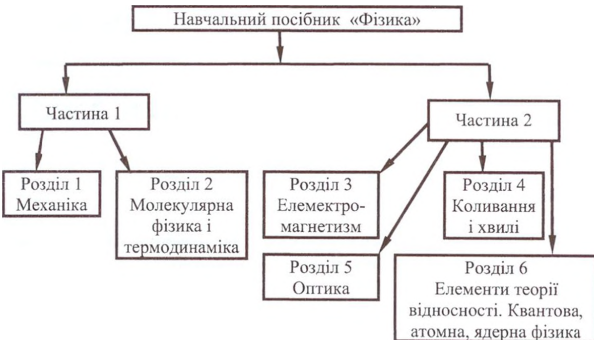
Рис. 1. Структура навчального посібника

Він складається з двох частин, структура яких подана на рис. 2. Як бачимо, перша частина містить два розділи, друга – чотири. Структура кожного розділу однакова і показана на рис. 3 на прикладі розділу «Механіка». Кожен розділ навчального посібника складається з окремих тем. Наприклад, розділ «Механіка» розділено на такі: тема 1 «Кінематика. Рівномірний прямолінійний рух», тема 2 «Рівнозмінний прямолінійний рух», тема 3 «Прямолінійний рух під дією сили тяжіння», тема 4 «Криволінійний рух» та тема 5 «Рівномірний рух по колу».