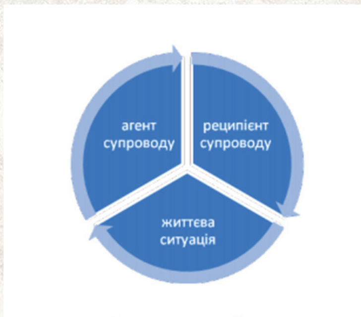
Рис. 1. Модель горизонтальної структури соціально-психологічного супроводу

Автором розроблено оригінальну концептуальну модель соціально-психологічного супроводу постраждалих від воєнних дій. Супровід визначено як спеціально організовану діяльність, що забезпечує відновлення психологічного здоров'я та конструктивні особистісні трансформації. Розглянуто також взаємозв'язок компонентів горизонтальної моделі соціально-психологічного супроводу (рис. 1): 1) реципієнта, споживача, «юзера», якого супроводжують; 2) агента, тобто спеціаліста, групи, спільноти, що беруть участь у супроводі; 3) життєвої ситуації, що сприяє чи заважає взаємодії реципієнта й агента.