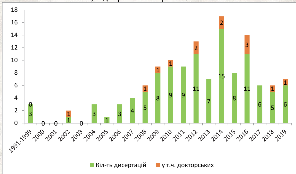
Рис.1 Динаміка захисту дисертаційних досліджень з проблем, пов'язаних з використанням ІКТ в освіті

Динаміка захисту дисертаційних досліджень з проблем, пов'язаних з використанням ІКТ в освіті, відображено на рис. 1.