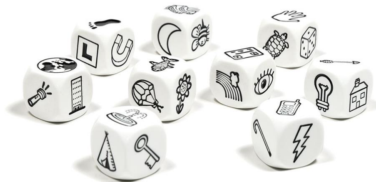
Рис 2. Rory's Story Cubes

Рорі О'Коннор, тренер креативності, запропонував серійні «Казкові кубики історій Рорі» (Rory's Story Cubes), які допомагають скласти історію використовуючи малюнкові підказки (див Рис.2).