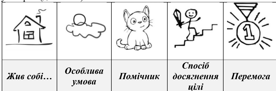
Рис 1. Картки Проппа (вибіркова частина)

Пропп В.Я. розробив і апробував «конструктор казок», який дозволяє познайомитися з функціями (структурними елементами) та способами складання казкових історій з допомогою зображень [7]. Методика налічує 28 картинок з відповідною підказкою, що дозволяють у різній комбінації скласти тематичну казкову історію (див Рис.1).