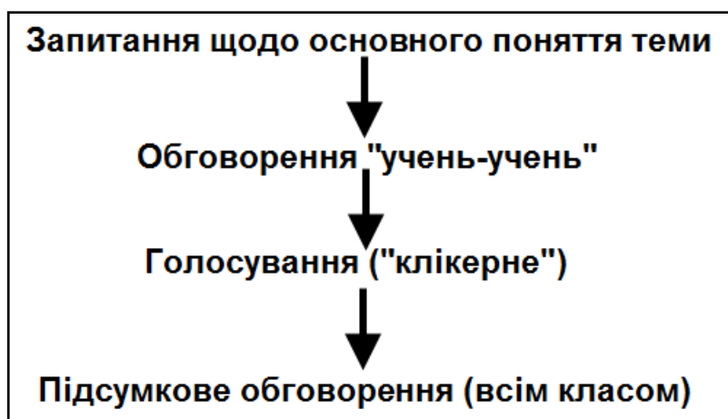
Рис.2. Схематичне зображення організації роботи в класі з клікерними запитаннями під час лекції з використанням інтерактивних комп'ютерних моделей

Вчителям запропонована модель з використанням «клікерних» запитань при поясненні нового матеріалу чи фронтальному експерименті (Рис.2):