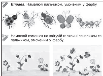
Іл. 1.1.4. Завдання