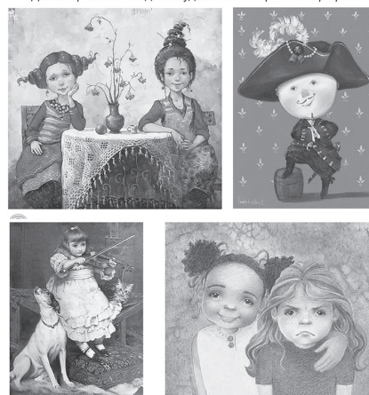
Іл. 2.2.1. Ілюстрації для сприймання: портрети

Для зображення людини художники створюють портрети.