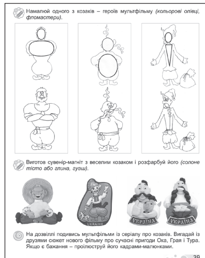
Іл. 3.2.1. Варіанти завдань з художньо-практичної діяльності

Героїзм доцільно розкривати на доступній для третьокласників тематиці українського козацтва, яка широко відображена у всіх видах мистецтва (згадаємо картину «Козак Мамай»). Компаративним методом варто зіставити живописні образи І. Рєпіна «Запорожці пишуть листа турецькому султанові» зі скульптурною групою за мотивами цього самого шедевра, а також із фотокомпозицією. Тема українських козаків достатньо відображена в пісенній і маршовій музиці й українському кінематографі («козацький» мультсеріал (іл. 3.2.1)).