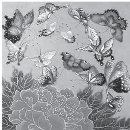
Іл. 1.1.2. Ган Інх-Сан «Метелики»