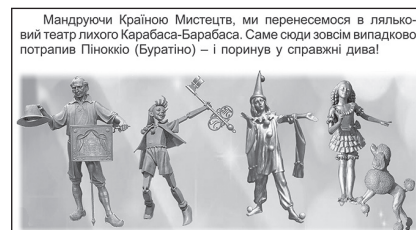
Іл. 2.2.2. Персонажі казки

Добірка портретів охоплює живопис і скульптуру, одинарний і парний портрети дітей. Під час виконання практичної роботи учні обирають для малювання персонаж, який найбільше сподобався (іл. 2.2.2), привернув увагу: веселого Буратіно або засмученого П'єро, казкового героя або героїні (іл. 2.2.3), у тому числі й з природних матеріалів (сухого листа, трави, квітів) (іл. 2.2.4).