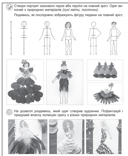
Іл. 2.2.4. Варіанти завдань з художньо-практичної діяльності

Музика представлена портретами героїв з літературних творів. Український композитор С. Борткевич створив «Музичні картинки за казками Андерсена», цикл починається з п'єси «Принцеса на горошині». Плавний рухливий танець тарантела характеризує витончену головну героїню, яка ніяк не може заснути. Моріс Равель написав сюїту «Моя матінка Гуска» за відомими казками Шарля Перро. Характер красуні в п'єсі, що відкриває сюїту, композитор передає в повільному танці павана, яким у далекому минулому відкривали королівські бали. У п'єсі «Красуня і Чудовисько» мовою музики відображено діалог персонажів казки.