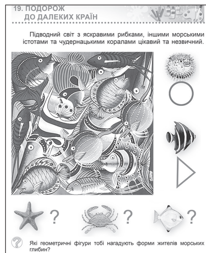
Іл. 1.2.2. Картина Е. Тінгатінга. Форми рибок