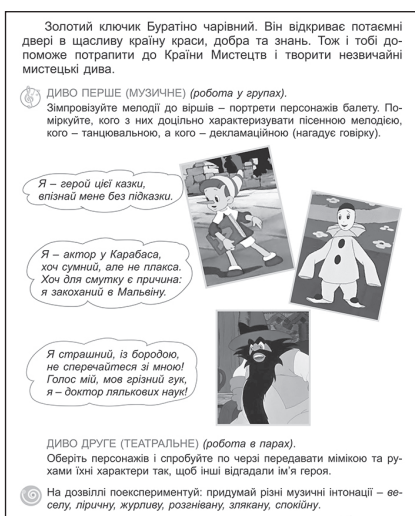
Іл. 2.2.5. Завдання з театралізації

Сутність комплексної інтеграції полягає в одночасному поєднанні основних видів інтеграції, зазначених і