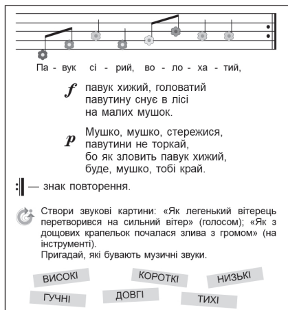
Іл. 1.1.1. Музичний компонент уроку

У перебігу музично-дидактичної гри «Луна» засвоєння музичних понять уроку «форте» і «піано» можна додатково закріпити візуальним порівнянням – зіставленням відтінків одного кольору (поспівки «Ку-ку» чи «Ку-рі-ку», що імітують голоси зозулі та півника).