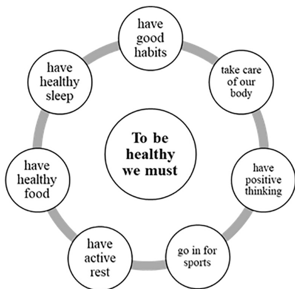
Рис. 3. What must we do to be healthy?

Наприклад: дискусійне питання To be healthy we must... Ймовірні продовження фрази: have healthy food, have healthy sleep, have good habits, have positive thinking, have regular active rest, take care of our body, take care of our clothes, take care of the place we live, go in for sports or do physical exercises, etc. (рис. 3).