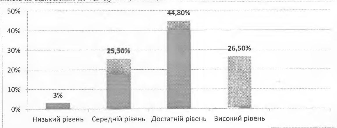
Рис. 1. Результат самооцінювання майбутніми майстрами ресторанного обслуговування рівнів сформованості ключових компетентностей

різноманітності культурного самовираження; ініціативність; готовність до відповідальних дій та прийняття самостійних рішень у виробничих ситуаціях; уміння працювати в команді; здатність керувати емоціями; володіння навичками професійної мобільності; усвідомлення необхідності навчатися впродовж життя; здатність розвивати свої особисті якості та професійні навички для досягнення кар'єрного зростання; здатність до систематичного професійного вдосконалення і саморозвитку тощо). На рис. 1 проілюстровано загальний результат самооцінювання майбутніми майстрами ресторанного обслуговування рівнів сформованості ключових компетентностей.