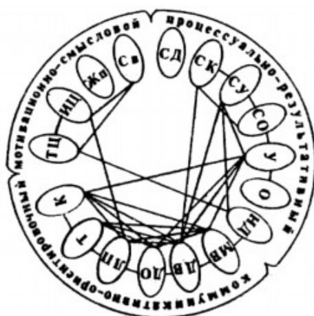
Рис.2. Графическое изображение связей между компонентами мотивационно-смыслового, процессуально-результативного и коммуникативно-ориентировочного аспектов ЦО девочек-подростков

Целостный анализ структуры ЦО девочек и мальчиков подросткового возраста. В соответствии с предложенной моделью следующий этап исследования – синтез всех компонентов модели в их связях и отношениях. С этой целью параметры ЦО подростков были подвергнуты корреляционному, факторному и кластерному анализу. Результаты первого позволили выявить основные связи компонентов ЦО; второго и третьего – более детально проанализировать связи между параметрами ЦО. Полученные данные свидетельствуют о различиях в целостной структуре ЦО у девочек и мальчиков. Основные различия заключаются в характере связей компонентов мотивационно-смыслового, процессуально-результативного и коммуникативно-ориентировочного аспектов ЦО подростков. Графически эти связи изображены на рис.2 и 3.