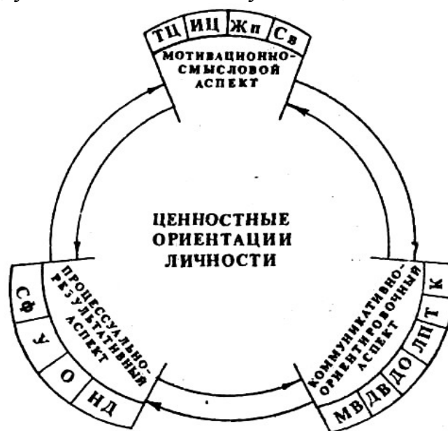
Рис.1. Модель целостного, многоаспектного анализа ценностных ориентаций личности подростков

переоценка ценностей. В качестве конкретных компонентов мотивационно-смыслового аспекта ЦО можно выделить: ценности – терминальные (ТЦ) и инструментальные (ИЦ), свойства личности (Св), жизненные планы (Жп); процессуально-результативного: основные сферы (Сф) деятельности (досуговую – СД, учебно-познавательную – СУ, общественной работы – СО,