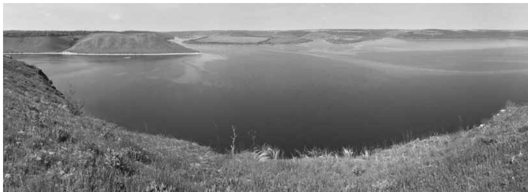
Бакотська затока — Дністровське водосховище

У результаті археологічних досліджень 60-х початку 80-х років в Бакоті з'ясувалася й вималювалася загальна історична картина формування та розвитку давньоруської столиці Пониззя та її подальша доля в період пізнього середньовіччя. Саме тоді стало зрозуміло, чому саме Бакоту визнали центром Пониззя, а не Ушицю, Калус, Хотин. Цьому сприяли різні фактори: природно-географічний, соціально-економічний, релігійно-культурний і політичний, що і підтверджують дані розкопок, наукових досліджень, свідчення літопису. Основними компонентами літописної Бакоти є наявність дитинця, посаду, окремого замку і скельного печерного монастиря. На основі порівняльних даних учені визначили, що територія, яку займало місто, становила приблизно 10 гектарів із населенням, а населення — 2—2,5 тисячі жителів, що відносить його до третьої групи міст того часу (За І. Мелікою).