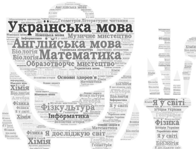
Мал. 1. TagCloud за темою «Що вчать у школі»

Актуальність використання цієї візуалізації у зазначеному контексті визначається 1) психологічною суттю поняття «слово» як стимулу до відтворення у свідомості людини певного образу та 2) особливостями сприйняття, усвідомлення, запам'ятовування та впровадження у практичну діяльність дітьми молодшого шкільного віку нової інформації, які будуються на фундаменті наочно-образного та наочно-дійового мислення.