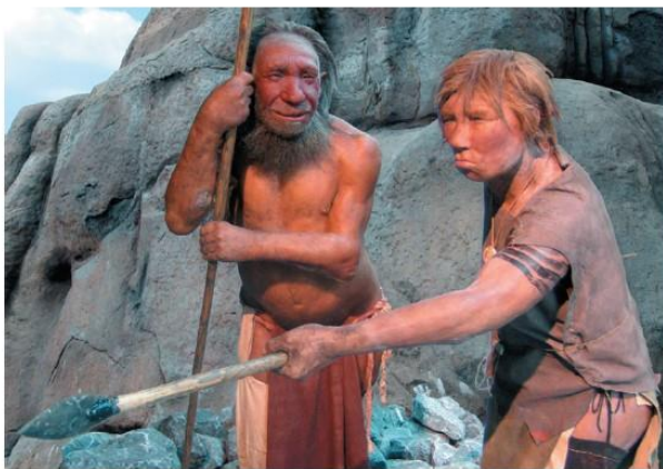
▲ Неандертальці (сучасна реконструкція за рештками). Неандертальський музей, Німеччина

Ще одним ефективним способом розвитку вміння висувати гіпотези є виконанням завдань на кшталт «скільки способів застосування предмета». Вчитель називає будь-який предмет побуту людей давнини, їх знаряддя праці тощо. Учням потрібно перерахувати якомога більше різноманітних способів його застосування. Перемагає той, хто вкаже більшу кількість різноманітних функцій предмета. Наприклад, це можуть бути знаряддя праці неандертальця чи кроманьйонця.