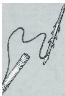
▲ Наконечник від гарпуна