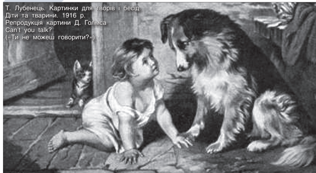
Т. Лубенець. Картинки для творів і бесід. Діти та тварини. 1916 р. Репродукція картини Д. Голмса Can't you talk? («Ти не можеш говорити?»)

КОЖНА БЕСІДА – ЦЕ СВОЄРІДНА НАУКОВО-ПОПУЛЯРНА ІНТЕРАКТИВНА ЛЕКЦІЯ, ОСКІЛЬКИ НАПИСАНА ВОНА ЖИВОЮ МОВОЮ З ПОСТІЙНИМИ ЗВЕРНЕННЯМИ ДО ДОСВІДУ ЧИТАЧА