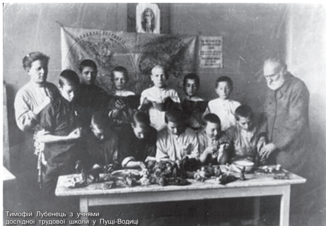
Тимофій Лубенець з учнями дослідної трудової школи у Пущі-Водиці

та оформлення класних кімнат. Окремо наголосив, що найкраща наочність — це природа. Водночас Тимофій Григорович зауважував, що, крім зовнішньої наочності, вчитель має застосовувати і внутрішню, а саме: тон мовлення, вираз обличчя, жести, порівняння, образні висловлювання, прислів'я, притчі тощо. Однак науковець не обмежується лише теорією і, прагнучи забезпечити вчителів роздатковим дидактичним матеріалом, 1916 року видає унікальний навчальний посібник «Картинки для творів і бесід». Спонукало його до цього видання, зокрема, листування з Педагогічним музеєм зі штату Массачусетс (США), де було видано каталог із 10 000 знімків. Тимофій Лубенець пише: «В американських школах широко застосовують наочність. Американці в цьому відношенні перевершили самих себе. Вони зуміли у всіх відомих музеях Європи зробити знімки з картин, що мають за своїм змістом і художнім виконанням педагогічну цінність. Картини ці безплатно розсилаються по школах». Посібник Тимофія Лубенця складається з 8 випусків по 10 картинок у кожному: «Сім'я», «Діти», «Діти і тварини», «Тварини», «Школа», «Заняття», «Види [Природа]», «Релігія». Зміст ви-