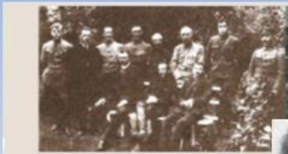
Керівництво Директорії (1918 р.)