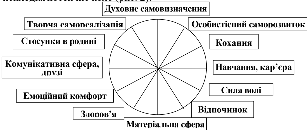
Рис. 2. Психодіагностичне «Коло життя».

Далі результати, отримані за методиками «Гармонійність особистісного розвитку» і анкета «Самооцінка сфер життя» заносяться у психодіагностичне коло (рис. 2).