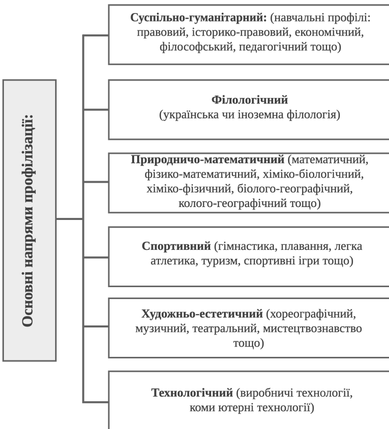
Рис. 2. Основні напрями профілізації в старших класах закладів середньої освіти

Структурно профільне навчання в старших класах закладів середньої освіти охоплює такі основні напрями профілізації: суспільно–гуманітарний, філологічний, природничо–математичний, спортивний, художньо–естетичний, технологічний (див. рис. 2).