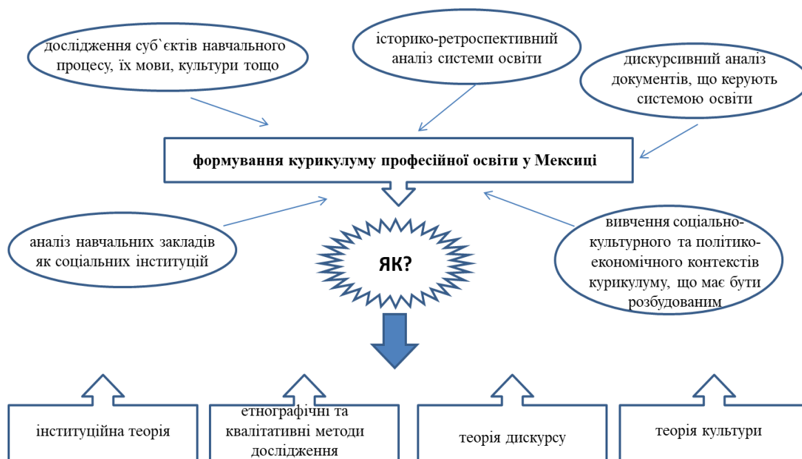
Рис. 2. Формування курикулуму професійної туристичної освіти у Мексиці

Висновки. Отже, інституційна теорія є основою формування курикулуму професійної освіти фахівців сфери туризму у соціально-критичній перспективі. Інституційний аналіз навчальних закладів та процесів, що в них відбуваються, є новим напрямом критичного розгляду освітньої галузі (див. рис. 2).