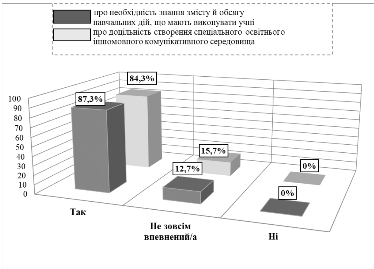
Рис. 1. Про знання змісту й обсягу навчальних дій та створення освітнього іншомовного комунікативного середовища

Як свідчать зазначені в таблиці 1 дані, більшість педагогів вважає, що формування чотирьох зазначених компетентностей необхідне в усіх класах, починаючи з першого. Показник позитивної відповіді «так» зростає з класу в клас: з мовної компетентності з 53,7% в 1-му класі до 80,6% в 4-му класі; з мовленнєвої – з 55,2% до 78,4%; із соціокультурної – з 50,0% до 80,6%; із