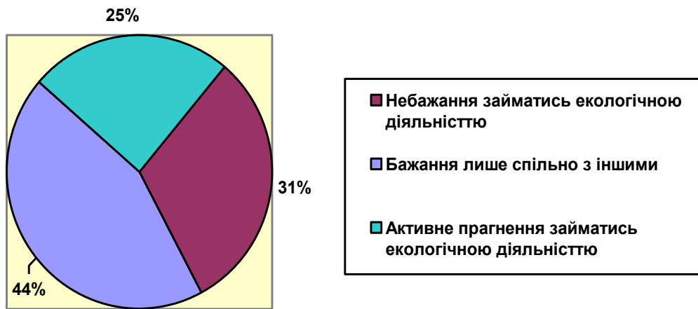
Рис.2. Спрямованість підлітків на участь у екологічній діяльності

Більшість учнів 6-7 класів визнають за живими істотами право на життя і свободу, однак 94,6% допускають природонебезпечні дії щодо них; кількість етичних мотивів у дівчат всіх вікових категорій більша, ніж у хлопців, і ставляться до природних об'єктів вони по різному (так, до неживої природи, як до ресурсу у 7 класі ставляться 37, 5% хлопців і лиш 6,7 % дівчат, а як до частини природи, яка потребує такого ж захисту, як і жива – 25% хлопців і 66,2 % дівчат). У споживанні мотиви етичного характеру зустрічаються лише у 6 класах. В усіх інших вікових категоріях превалюють традиційні економічні мотиви. Якщо виокремити площини взаємодії школярів з природою – живі істоти, нежива природа, екосистеми та природні ресурси – рівень етичної мотивації зменшується від першого до останнього.