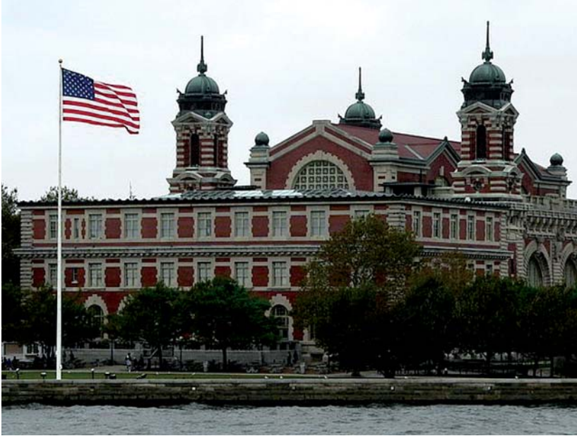
Рис. 2 Головний будинок музею імміграції Еліс-Айленда

Починаючи з 1990 р., в колишньому головному будинку центру працює музей імміграції Еліс-Айленда (EllisIslandImmigrationMuseum), який, поза сумнівом, заслуговує відвідування. Докладаються зусилля щодо приведення в належний стан і збереження решти будівель. Зокрема, у 2007 р. було відкрито для відвідувачів відреставрований Паромний будинок, де працювала тематична виставка «Майбутнє – за збалансованістю: іммігранти, громадська система охорони здоров'я та еліс-айлендські лікарні».