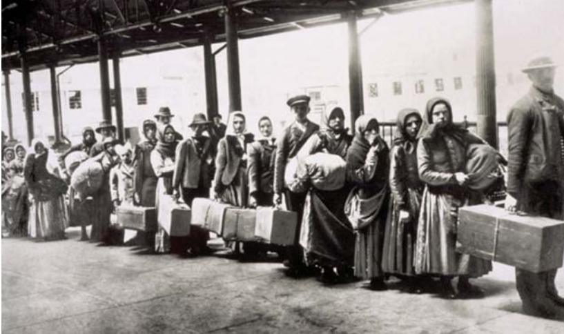
Рис. Імміграція до Нью-Йорку

З чого розпочинався Нью-Йорк? З комерції. Велика частина європейських колоній в Новому Світі виникла в результаті релігійних і інших гонень у Світлі Старому. На цьому тлі перші поселенці острова Мангеттен, голландці, виділялися малою зацікавленістю в духовному розвитку. Але що привело їх сюди? Боброві шкури. На початку 17-го століття вироби з бобрових шкур були предметом розкоші в Європі. Генрі Гудзон у своїх невдалих пошуках протоки в Китай примітив біля берегів річки, яку назвав на честь святого Маврикія (майбутня річка Гудзон), безліч бобрів, що акуратно заніс у бортовий журнал. Вже в 1612 р. на території сучасного штату Нью-Йорк почали з'являтися мисливці на бобрів, а в 1624 р. було засновано поселення в найпівденнішій точці острова Мана Хата. Це селище до 1625 р. відбудувало оборонний форт і було назване Новим Амстердамом.