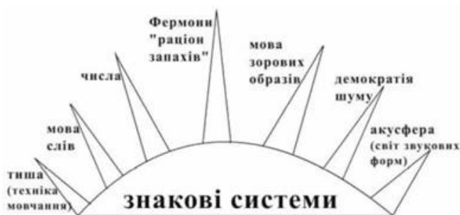
Рис. 19.1. Знакові системи

Розрізняють наступні види знакових систем: