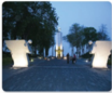
А. Скульптура автора при вході та «Сана пам'ят'» вдалі

Завдання: На основі тексту підручника та ілюстрації підготуйте відповіді на запитання: Як події Голодомору відображені в експозиції та пам'ятках Національного музею «Меморіал пам'яті жертв Голодомору в Україні»? Як пошути висловити у вас емоції та пам'ятки музею?