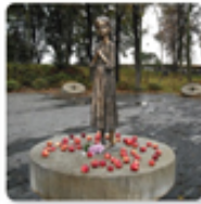
А. Скульптурна композиція «Дження з колосами»