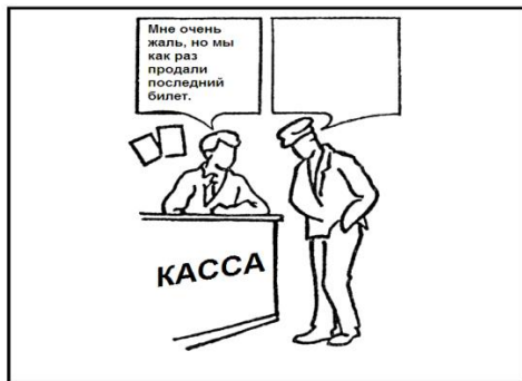
Рис.2. Малюнок № 10 напівпроективної методики визначення ступеню сформованості асертивної поведінки.

неповнолітніх. В модифікації методики на картинці №10, зображені ті ж самі люди, але зображена ситуація в касі, де надпис „Мені дуже шкода, але ми якраз продали останній квиток” (рис. 2).