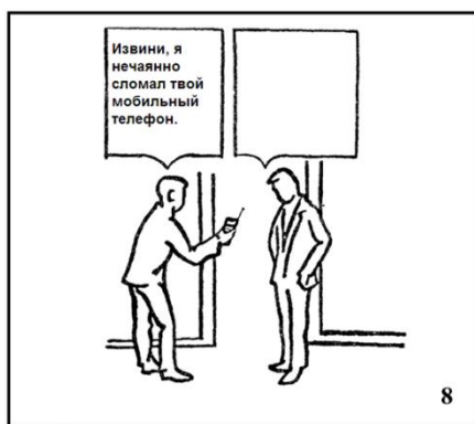
Рис. 1. Малюнок №8 напівпроективної методики визначення ступеню сформованості асертивної поведінки.

Розглянемо модифікацію методики за блоком „перешкода”, що включає п’ять малюнків. Деталі малюнку № 8 були змінені з метою наближення ситуації до реальних подій, які є актуальними для віку неповнолітніх засуджених. Наприклад, на картинці оригіналу зображено дві людини, одна з яких дає іншій розірвану газету та говорить „Ось Ваша газета. Мені дуже шкода, що дитина її розірвала”. Розірвана газета не актуальна в теперішній час, тому ситуація не несе заданого смислового навантаження. В модифікації методики на картинці №8 зображені ті ж самі люди, але газету замінено на мобільний телефон (рис.1). Полонка мобільного телефону більш значима для підлітків, ніж розірвана газета.