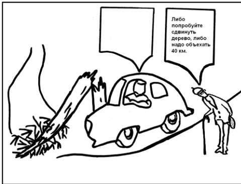
Рис. 4. Малюнок №12 напівпроективної методики визначення ступеню сформованості асертивної поведінки.

На малюнку №12 (рис.4) зображено ситуацію перешкоди на дорозі, коли дорогу, якою їхала людина перекрило зламане дерево. На узбіччі дороги стоїть чоловік похилого віку, який говорить водію машини: „Або спробуйте пересунути дерево, або потрібно об'їхати 40 кілометрів”.