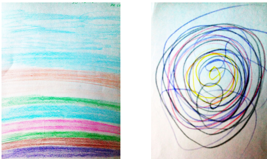
Рис. 2 Малюнок діалогічного (ліворуч) та маніпулятивного текстів.

Дані емпіричного дослідження показують, що читачі відчують, впізнають тексти діалогічної чи маніпулятивної спрямованості і реагують на них. Неприйняття маніпуляцій пов'язане з почуттям довіри до себе, свого досвіду, власних цінностей, але коли людина втрачає довіру до себе і здатність протистояти агресивному тиску, коли вона дезорієнтована, тоді виявляє потребу у психологічній допомозі.