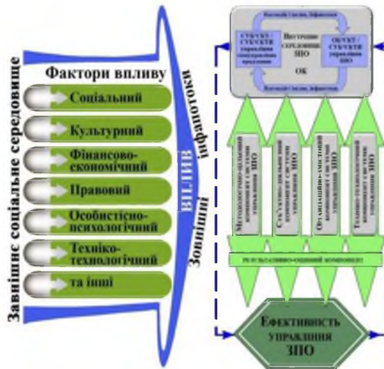
Рис. 1. Модель системи управління багатопрофільним закладом позашкільної освіти як відкритою соціальною системою

на законодавчо-державницьких засадах розвитку сфери освіти, ідеї дитино(людино)центризму за теорією В. Кременя.