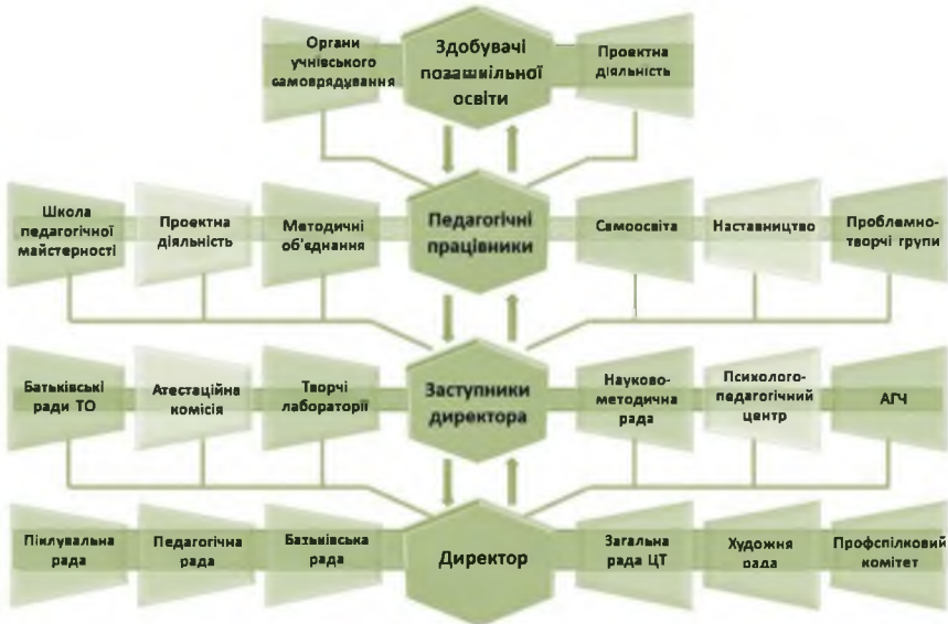
Рис. 2. Суб'єктно-діяльнісний компонент системи управління багатoproфільним ЗПО

Суб'єктно-діяльнісний компонент системи управління багатoproфільним ЗПО представлено суб'єктами управління, органами громадського врядування та дитячого (учнівського) самоврядування, а також логікою процесуальних дій щодо здійснення управлінської діяльності, що схематично представлено на рис. 2.