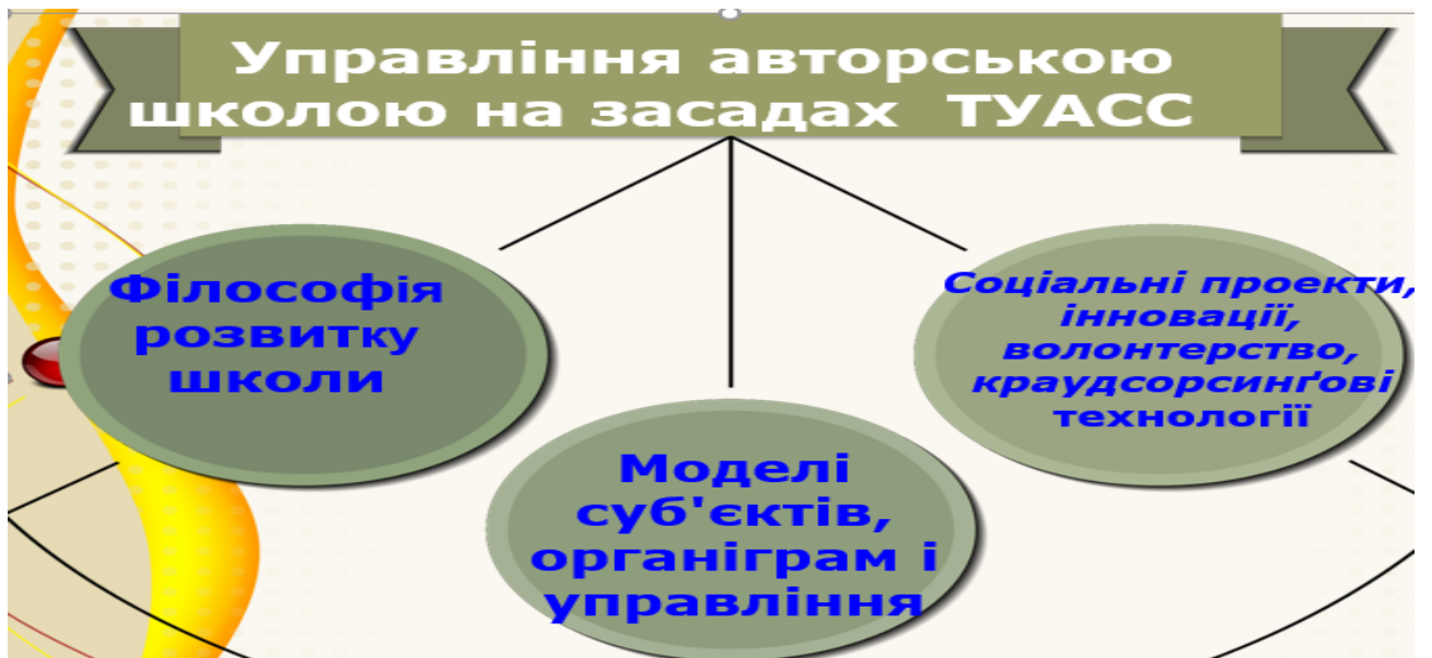
Рис. 2. Концептуально-філософські засади управління МАДТ